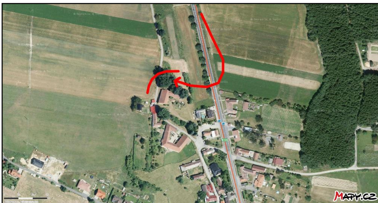
Lieu de l'accident