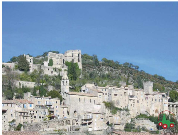
Montbrun les Bains

En toutes saisons, on est assuré en Drôme-Provençale de faire une bonne ballade, et parfois elle est agrémentée d'une découverte du patrimoine aéronautique. Lorsqu'on arrive à Montbrun les Bains, charmant village accroché aux collines, on a une vue exceptionnelle sur la face nord du Mont Ventoux.