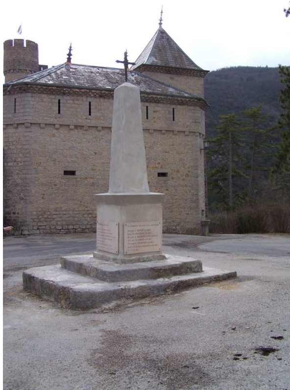
Le Monument aux Morts d'Aulan

Le village d'Aulan, un ensemble de fermes dispersées, compte 5 habitants à l'année. Sur la place devant le château qui est aussi l'unique place du village, se situe le Monument aux Morts de la localité. Deux plaques retiennent notre attention: l'une à la mémoire du sous-lieutenant de SUAREZ d'AULAN et l'autre à la mémoire d'un équipage de l'aviation militaire américaine.