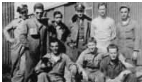
L'équipage du B 17